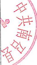
项目支出绩效自评情况表